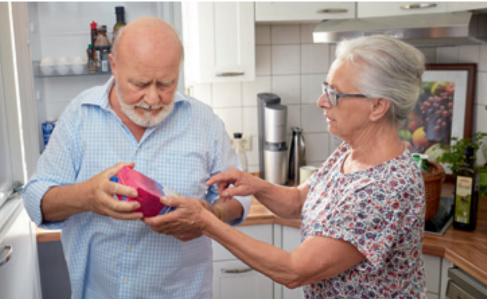
Menschen mit Demenz tut es gut, wenn man sie bei vertrauten Tätigkeiten wie Tischdecken oder Küchenarbeit einbezieht.

Viele Aufgaben werden von den Betroffenen nicht mehr so ausgeführt, dass sie den Maßstäben Gesunder genügen. Wichtiger als Perfektion ist aber, dass der erkrankte Mensch sich angenommen und nützlich fühlt – und Spaß bei seinem Tun empfindet. Werden beispielsweise beim Tischdecken die Untertassen vergessen oder wird das Besteck falsch angeordnet, sollte dies nicht unmittelbar vor den Augen der Kranken korrigiert werden, sondern eher dezent zu einem späteren Zeitpunkt. Kritik belastet an Demenz erkrankte Menschen enorm, da sie der Argumentation meist nicht mehr folgen können. Lob hingegen aktiviert und tut gerade den Kranken besonders gut. Sinnvoll sind auch sanfte Hilfestellungen, die die Arbeitsprozesse in überschaubare kleine Schritte gliedern. Bereitet etwa Kuchenbacken