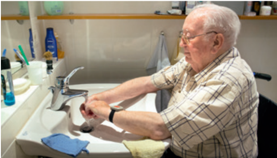
Ein barrierefreies Bad kann die Pflege zu Hause wesentlich erleichtern.

Wer möglichst lange in den eigenen vier Wänden wohnen und dabei ein weitestgehend selbstständiges Leben führen möchte, braucht eine Wohnung, die dies ermöglicht. Dafür muss diese womöglich entsprechend angepasst oder umgebaut werden. Ein barrierefreies Bad, die Anpassung einer Kücheneinrichtung oder die Beseitigung von Schwellen können die Pflege zu Hause wesentlich erleichtern und zugleich vor Unfällen schützen. Die Pflegeversicherung unterstützt deshalb bauliche Anpassungsmaßnahmen durch finanzielle Zuschüsse. Bereits ab Pflegegrad 1 können Betroffene diese Zuschüsse in Höhe von bis zu 4.000 Euro je Maßnahme für Anpassungen des individuellen Wohnumfeldes erhalten, wenn diese Maßnahmen die häusliche Pflege des Pflegebedürftigen in der Wohnung ermöglichen, erheblich erleichtern oder dadurch eine möglichst selbstständige Lebensführung wiederhergestellt wird. Die Finanzierung von