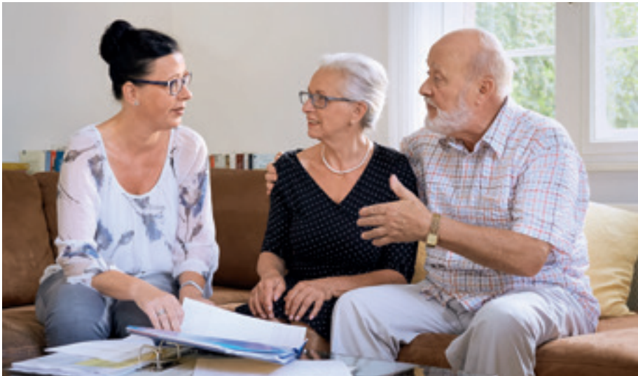
Gutachterinnen und Gutachter kommen ausschließlich nach vorheriger Terminvereinbarung zu Ihnen nach Hause.

Die jeweilige Gutachterin oder der jeweilige Gutachter kommt ausschließlich nach vorheriger Terminvereinbarung in die Wohnung oder die Pflegeeinrichtung – es gibt keine unangekündigten Besuche. Zum Termin sollten idealerweise auch die Angehörigen oder Betreuer des erkrankten Menschen, die ihn unterstützen, anwesend sein. Das Gespräch mit ihnen ergänzt das Bild des Gutachters davon, wie selbstständig der Antragsteller noch ist beziehungsweise welche Beeinträchtigungen vorliegen. Der Gutachter wird dabei nach dem