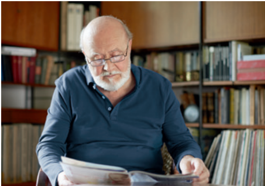
Positiv wirkt sich geistige Aktivität aus: Intellektuell wache Menschen erkranken seltener an Alzheimer.

Je älter die Menschen werden, umso größer ist das Risiko für Demenzerkrankungen. Während in der Altersgruppe der 65- bis 70-Jährigen weniger als drei Prozent an einer Alzheimer-Demenz erkranken, ist im Alter von 85 Jahren ungefähr jeder Fünfte und ab 90 Jahren bereits jeder Dritte betroffen.