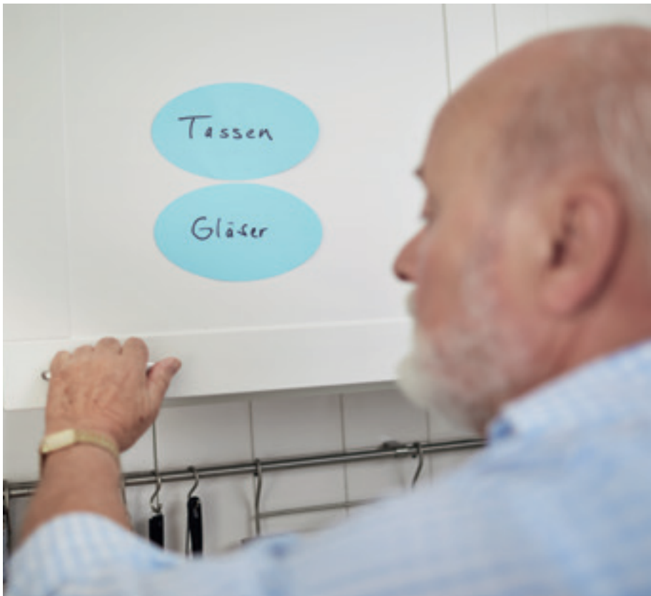
Alzheimer-Patienten benötigen Hilfen zur Orientierung.

In diesem Stadium nehmen die Kranken bewusst die Veränderungen wahr, die in ihnen vorgehen. Viele von ihnen reagieren darauf mit Wut, Angst, Beschämung oder Niedergeschlagenheit.