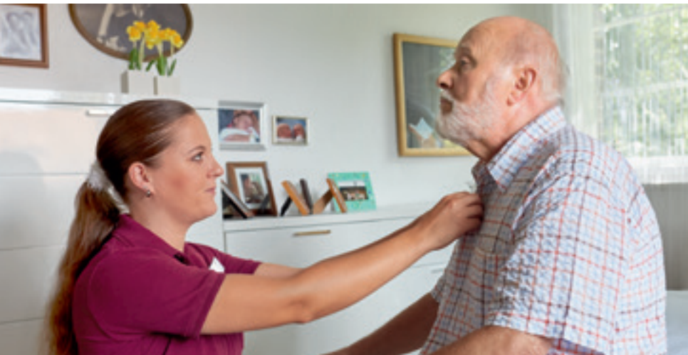
Menschen mit einer Demenzerkrankung benötigen Hilfe bei der Körperpflege und auch beim An- und Ausziehen.

So lassen sich manche Betroffene auch ungern von Verwandten – vor allem von den eigenen Kindern – waschen. In diesem Fall empfiehlt es sich, für die Körperpflege eine professionelle Pflegekraft zu